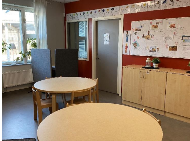
Det finns även ett mindre klassrum.