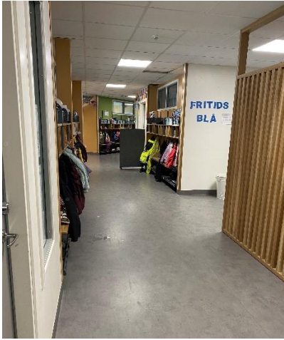
En bild från korridorren där alla har en egen hylla för sina kläder.